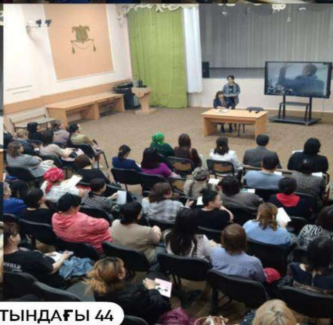
Д.ҚОНАЕВ АТЫНДАҒЫ 44 МЕКТЕП-ГИМНАЗИЯСЫ