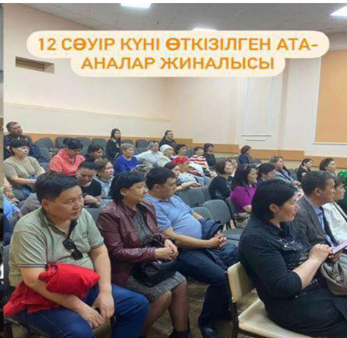
12 СӨУІР КҮНІ ӨТКІЗІЛГЕН АТА- АНАЛАР ЖИНАЛЫСЫ