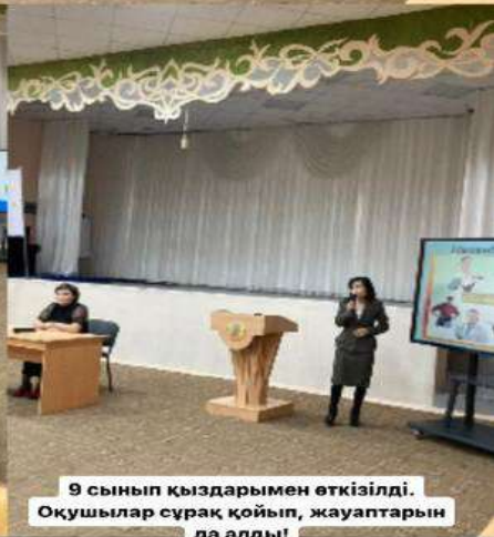
9 сынып қыздарымен өткізілді. Оқушылар сұрақ қойып, жауаптарын да алды!